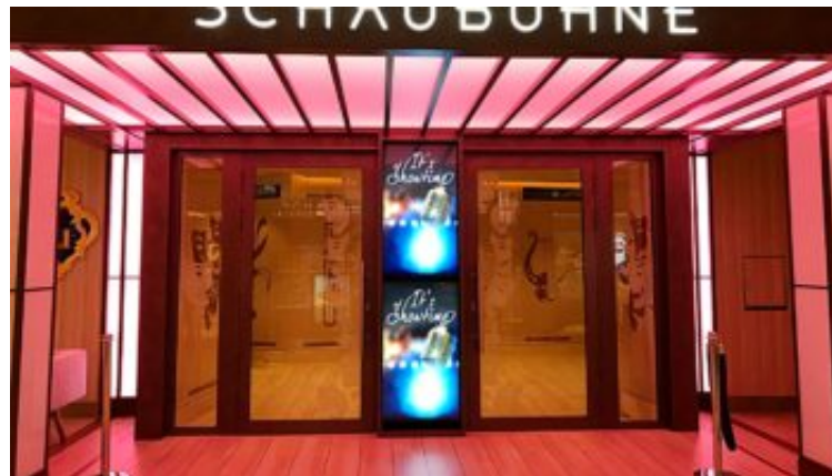
Das Theater für Kleinkunst an Bord: Schaubühne