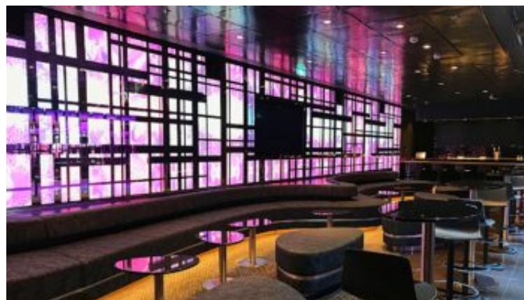
Abtanz Bar mit großer Tanzfläche auf der neuen Mein Schiff 2