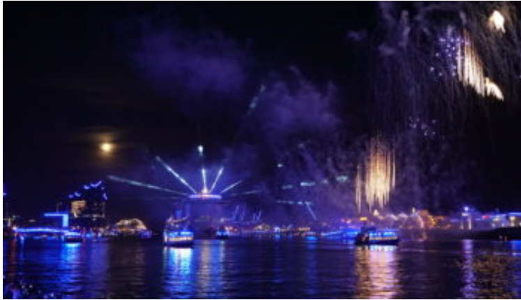
AIDaperla bei der Parade der 7. Hamburg Cruise Days