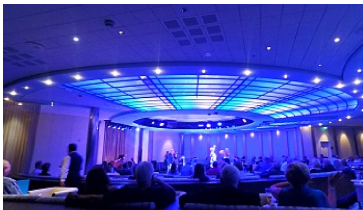
In der Reflections Lounge wird nachts durchgetanzt

Das italienische Steakhaus Tuscan Grill und das exklusive Ocean Liners bieten hervorragende Menüs. Das sollte jeder Gast ausprobieren.