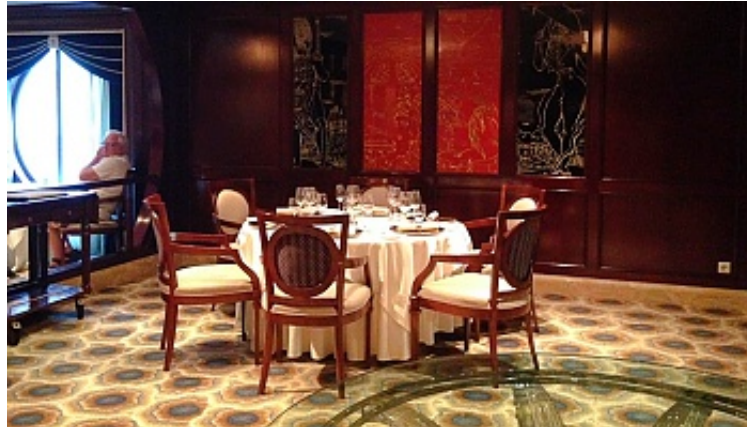
Das Ocean Liners Restaurant auf Deck 3