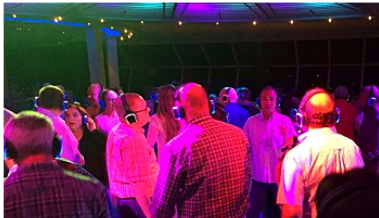
Silent Disco auf der Celebrity Konstellation

Ein Cocktail in der Reflections Lounge am Bug auf Deck 11. Die Cocktails und auch die Zutaten werden an Bord hergestellt. So werden die Säfte mehrmals täglich frisch gepresst und selbst der Sirup wird an Bord gemacht.